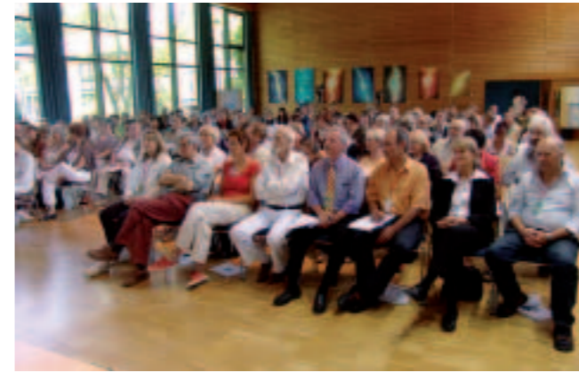
Die Tagungen zum Thema »Neue Homöopathie« erfreuen sich großer Beliebtheit.

Malen Sie mit einem Filzstift direkt auf die schmerzende Stelle ein Sinuszeichen (siehe Bild). Die meisten Anwender berichten darüber, dass der Schmerz innerhalb kurzer Zeit deutlich nachlässt. Unsere Redaktion freut sich auf Ihre Erfahrungsberichte, die wir mit Ihrer Zustimmung bei den Leserbriefen gerne veröffentlichen werden!