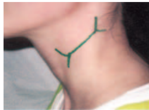
Dieses Zeichen soll die Schilddrüsenfunktion normalisieren.

...durch Verwendung farbiger, abwaschbarer und ungiftiger Filzschreiber in zwei bis drei unterschiedlichen Stärken, damit Anbringen der kosmischen Symbole auf den entsprechenden Hautstellen bei Tag und Nacht.